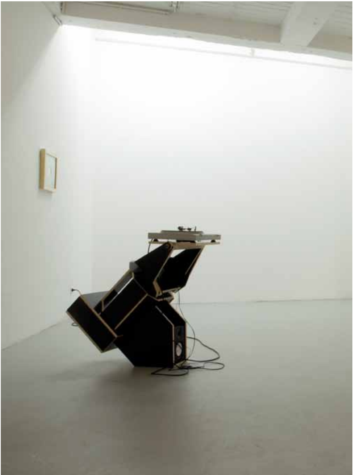
En attendant les pluies, Faux mouvement, Metz 1er plan, la main de Zeus (1) et Récession (2), (1) platine disque vinyle qui tourne en boucle, système sonore, CP de coffrage, 2011, (2) vinyle 33 t sérigraphié, 2011, Antoine Lejolivet arrière plan, Récession , pochette encadrée du vinyle 33t, 2011, Antoine Lejolivet