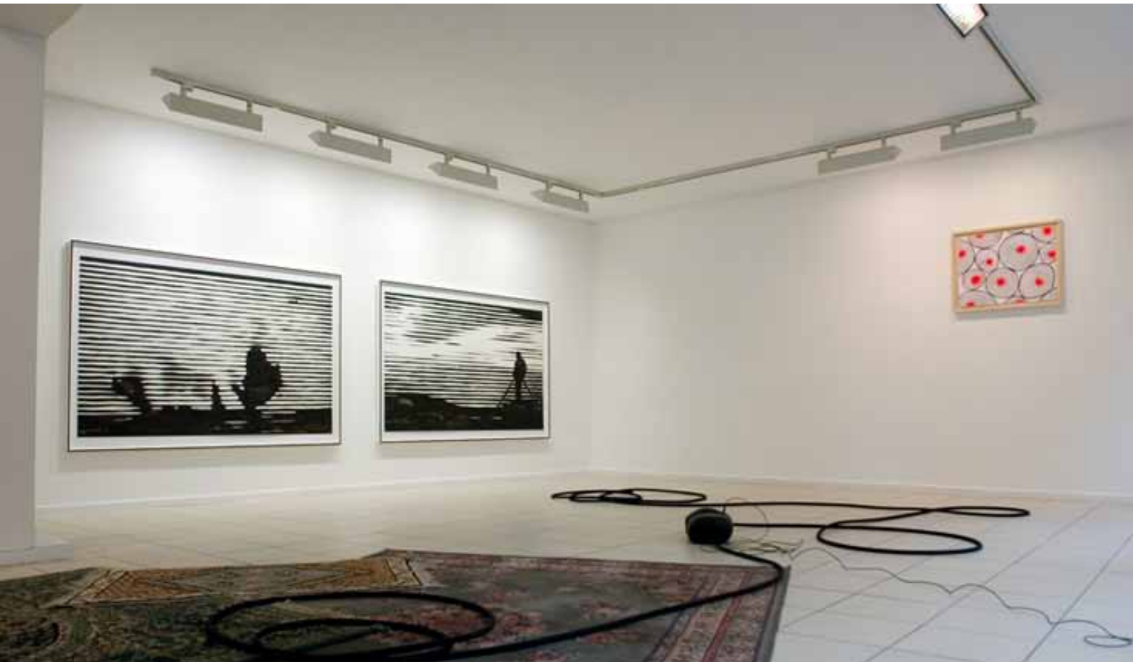
vue de l'exposition Fish & Chips , Galerie Lillebonne, espace d'art contemporain, Nancy