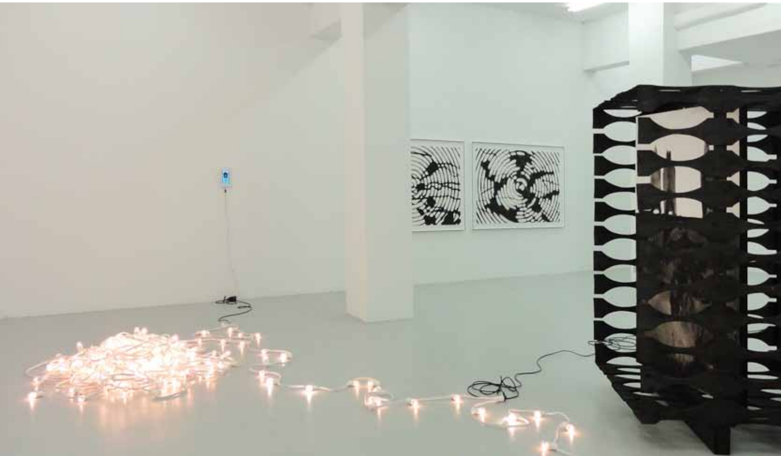
vue de l'exposition En attendant les pluies , centre d'art contemporain, Faux Mouvement, Metz