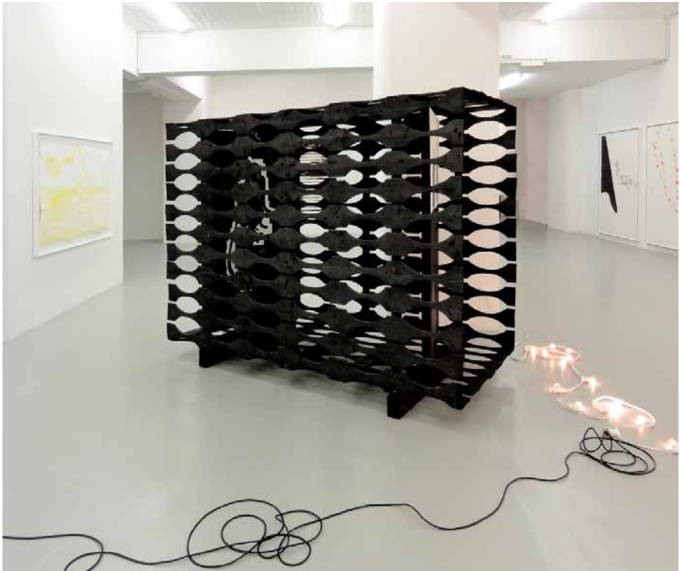
En attendant les pluies, Faux mouvement, Metz de gauche à droite, Triste lagune I , 2011, aquarelle sur papier, 170 x 110 cm, N.Schneider, Goodriver , 2010, Bois brûlé, aquarelles, 196 x 268 x 120 cm, N. Schneider, Lost in island , 2011, aquarelle sur papier, 140 x 200 cm, N. Schneider