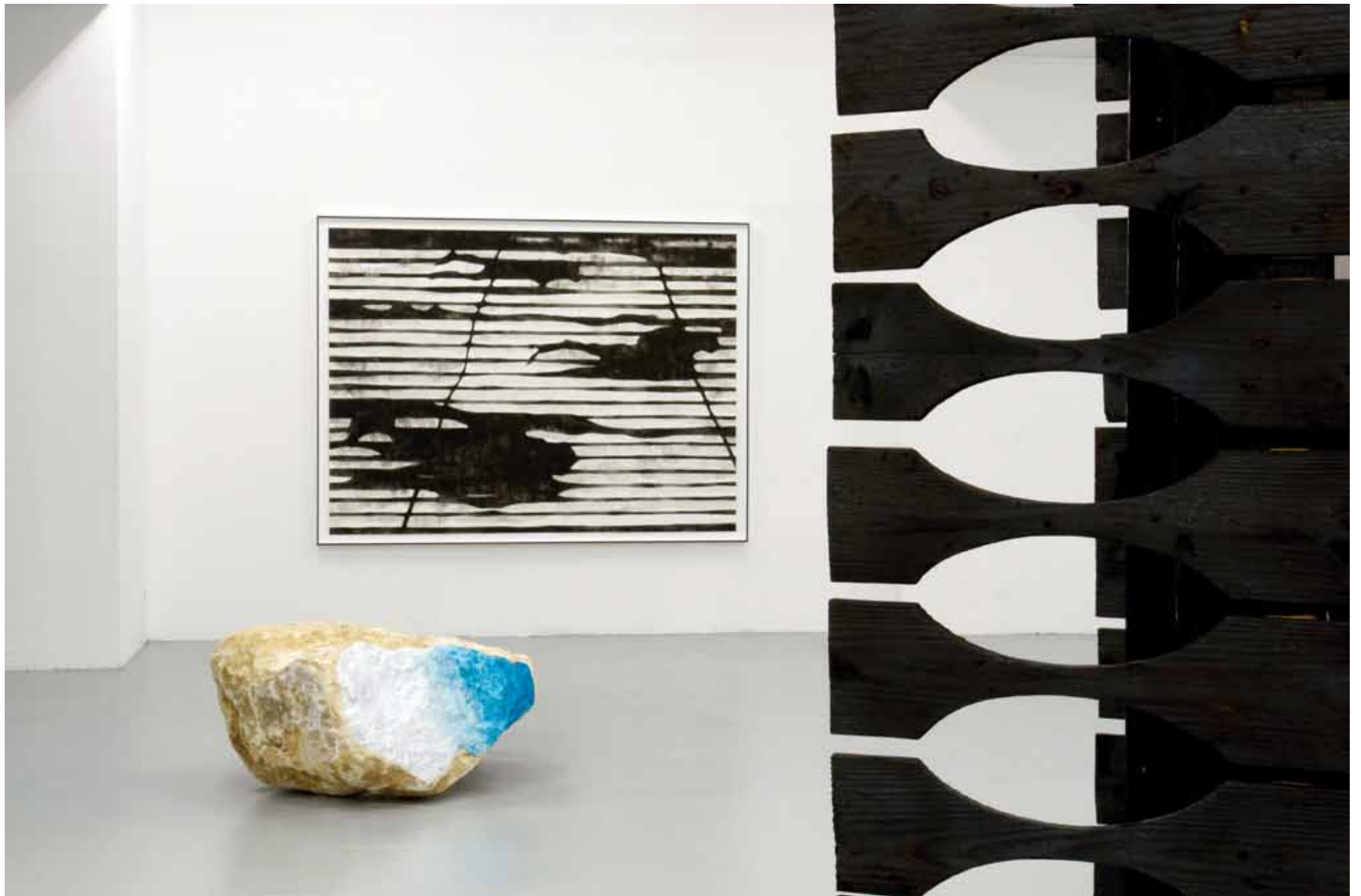
En attendant les pluies, Faux mouvement, Metz, 1er plan, 3D/Biela , rocher et maquillage, 2011, Antoine Lejolivet, au mur, Irrigation , 2011, aquarelle sur papier, 230 x 170 cm, Nicolas Schneider